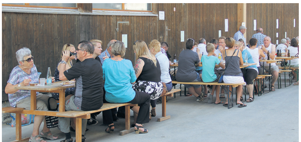
Zahlreiche Besucher nutzten die Gelegenheit einen Blick in die Gebäude zu werfen.

Ansprechperson PR / Marketing: Martin Aue c/o Marketlink Consulting GmbH, Telefon 033 650 10 10, martin.aue@marketlink.ch